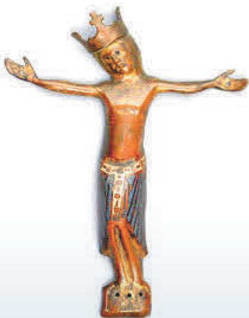
Christ roman, XIII e siècle

Seigneur Jésus Christ, tu es la Parole du Père. Tu es la Parole vivante qui transforme nos vies. Tu es la Parole de vérité qui éclaire nos esprits. Tu es la Parole d'amour qui réchauffe nos cœurs. Tu es venu nous livrer ton Évangile de salut !