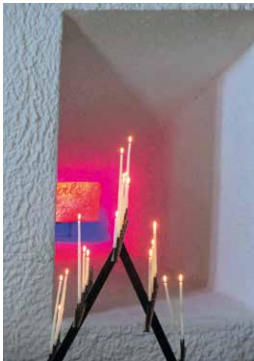
© François Bresson - Tous droits réservés, reproduction interdite sauf une publication dans le Saint Desle n°155