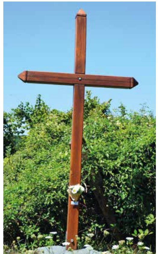
Une des cinq croix bénies.

« Un chant à la Vierge a fait vibrer les voix et les âmes, dans une douce harmonie entre tradition et espérance. »