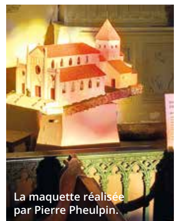
La maquette réalisée par Pierre Pheulpin.