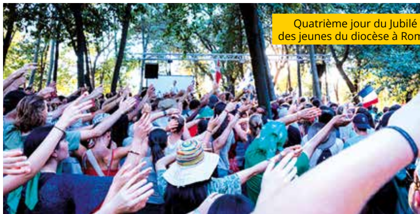
Quatrième jour du Jubilé des jeunes du diocèse de Rome.

IL Y A DEUX ANS, JE PARTICIPAI AUX JOURNÉES MONDIALES DE LA JEUNESSE (JMJ) À LISBONNE : UNE EXPÉRIENCE MARQUANTE, RICHE EN RENCONTRES, EN FOI ET EN ÉMOTIONS. CETTE ANNÉE, J'AI EU LA JOIE DE PARTICIPER AU JUBILÉ DES JEUNES À ROME AVEC LE DIOCÈSE DE BESANÇON.