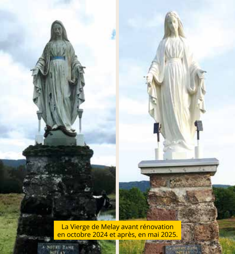
La Vierge de Melay avant rénovation en octobre 2024 et après, en mai 2025.