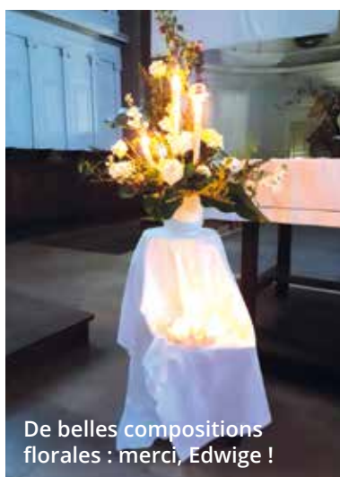
De belles compositions florales : merci, Edwige !