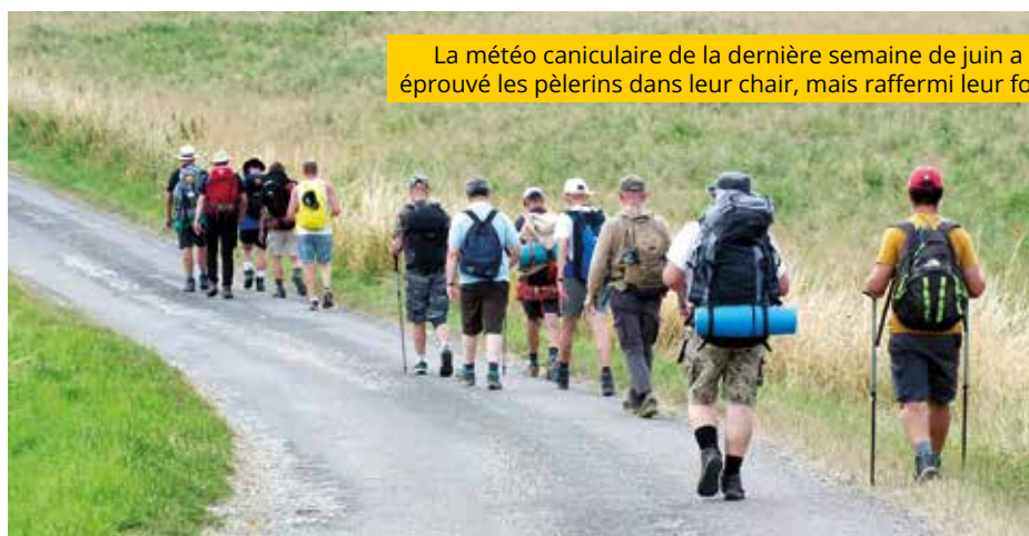
La météo caniculaire de la dernière semaine de juin a éprouvé les pèlerins dans leur chair, mais raffermi leur foi...

C'était dur physiquement, mais la fatigue et la douleur nous rendent plus humbles et nous aident à nous rapprocher. Il y a une entraide, une solidarité entre les participants qui fait qu'en quelques heures à peine, malgré les différences d'âge et de rapport à la foi et à l'Église, on forme un groupe uni, tourné vers saint Joseph et vers Dieu. La lectio divina *, tous les après-midi était un moment très riche, pendant lequel on était tous à l'écoute les uns des autres et pour entrer de plus en plus dans le texte... J'étais presque frustré qu'on n'en reparle pas encore pendant la soirée pour mettre en commun ce qui s'était dit dans