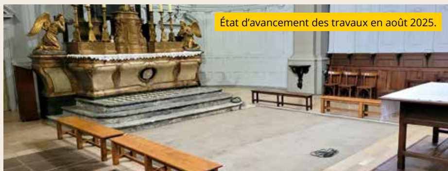
État d'avancement des travaux en août 2025.