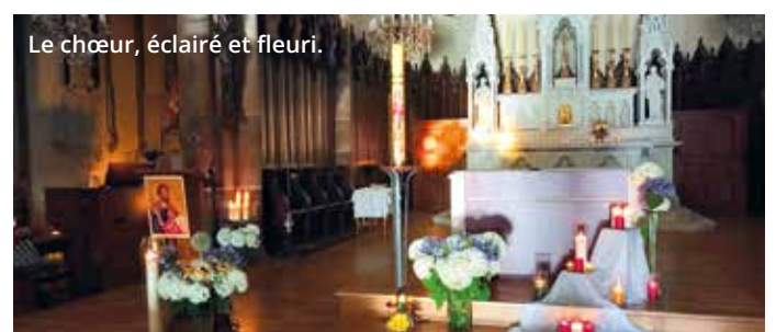
Le chœur, éclairé et fleuri.