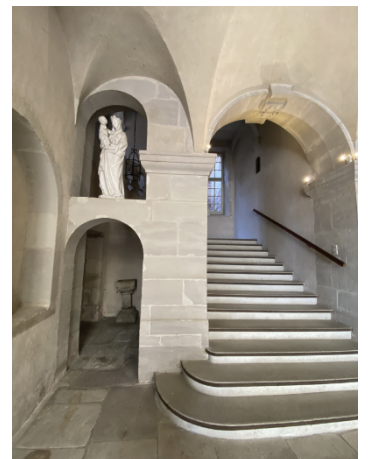
L'escalier des moines