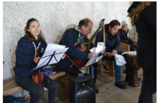
De 6 ans à 17 ans, fabrication d'étoiles et de pots bougies pour la célébration à la chapelle en musique