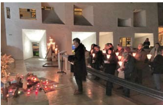
Noël Procession aux flambeaux

Deux nouveaux mécènes rejoignent notre club d'entreprises : CAM-BTP et Le Rotary de Besançon. Nous les remercions vivement pour leur soutien aux travaux de la colline.