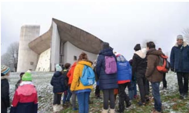
Visite des scouts et lumière de Bethléem

La session « Foi et art » à la Toussaint animée par le chapelain Axel Isabey, « d'un enterrement à Ornans à l'enciellement de Tolède » a porté une douzaine de personnes à la spiritualité et à la méditation ; comparaison instructive entre les peintres Gustave Courbet et Le Greco.