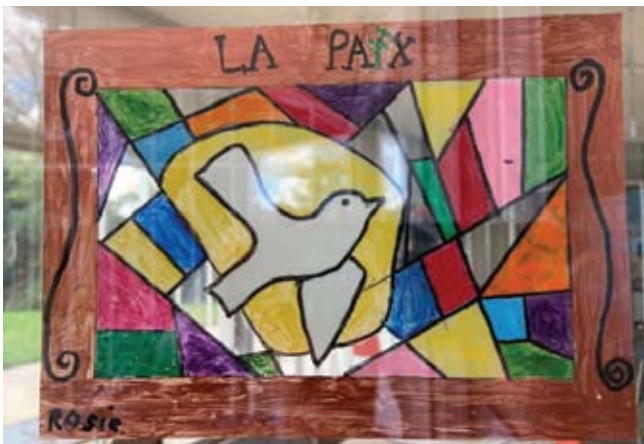
Un des 105 vitraux réalisés par les enfants de l'école de Ronchamp

L'économie vertueuse de Gemdoubts et Economie et foi chrétienne de la mission diocésaine alsace à l'écologie intégrale, ont intéressé une vingtaine de personnes.