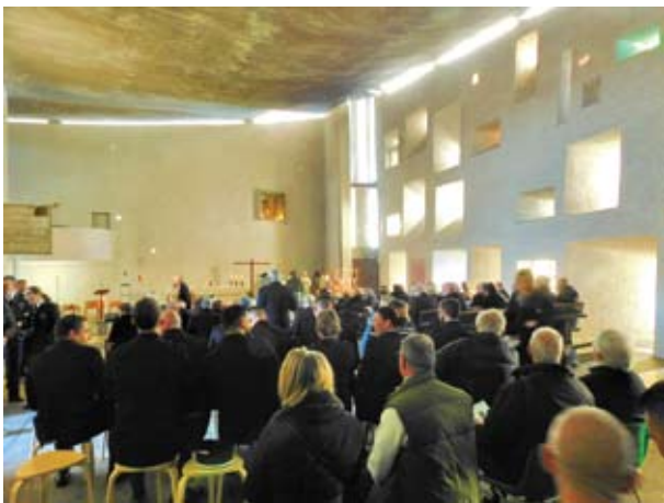
Fête de la Sainte Geneviève patronne de la gendarmerie

Noël 24 décembre veillée chaleureuse autour de la crèche à la chapelle. Projections de crèches d'artistes peintres commentées par le chapelain Axel.