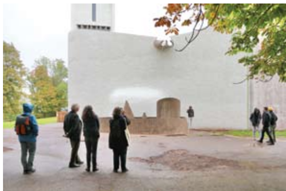
Réunion du Comité scientifique. Façade Est