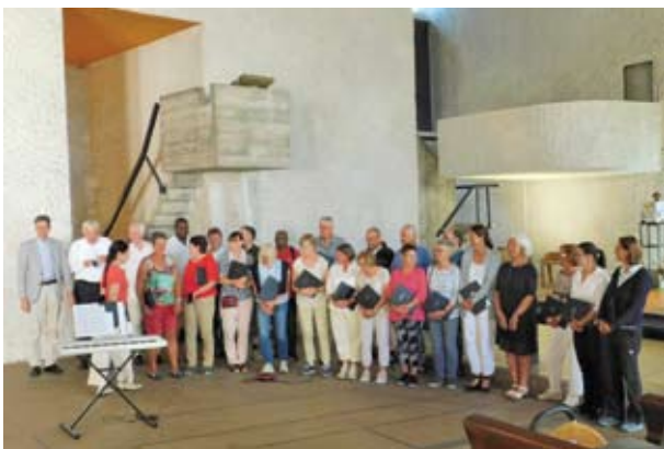
Chorale de Fribourg

Journées paix des écoliers de Ronchamp , 21 et 22 septembre, voir page suivante.