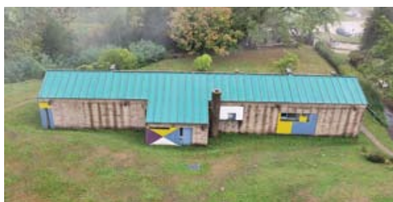
Toiture Abri bâchée, à isoler et végétaliser

FACADE Est : elle présente trois situations différentes d'intervention. Le mur arrière de l'espace du chœur est en maçonnerie traditionnelle, appareillage grossier lié au mortier. La paroi verticale à gauche qui conduit à la porte pivotante est la continuité du principe constructif de la paroi sud, un ciment projeté sur un squelette béton. La coque qui déborde largement sur l'espace liturgique, présente un voile de béton brut de décoffrage. La situation globale de l'état de conservation des épidermes des murs est très positive, situation résultant d'un espace abrité à l'opposé des vents dominants. La décision fut prise de ne pas proposer un décapage complet des différentes couches de peinture, mais après lavage, se limiter à des interventions minimums sur quelques fissures. Il est alors apparu que la perception de deux façades adjacentes présenterait des différences liées à la teinte et à la matière. Après lavage les surfaces seront repeintes en une couche d'homogénéisation