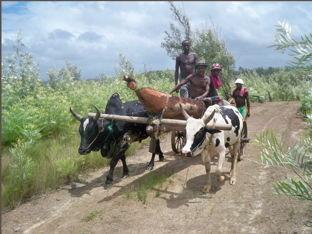
IMAGE TIRÉE DU FILM « COUPS DE HACHE POUR UNE PIROGUE »

Besançon accueille le réalisateur malgache GILDE RAZAFITSIHADINOINA, de Tamatave, du 3 au 8 novembre 2022.