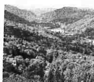
Vallée de l'Ognon vue du Ballon de Servance.

Le monde est plus qu'un problème à résoudre, il est un mystère joyeux contemplé dans la joie et dans la louange. 12