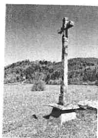
St Colomban à Annegray et Église St Martin à Faucogney

Loué sois-tu mon Seigneur par ceux qui pardonnent grâce à ton amour. Heureux ceux qui gardent la paix. Saint François