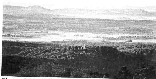
La Colline en Automne vue du Plainet