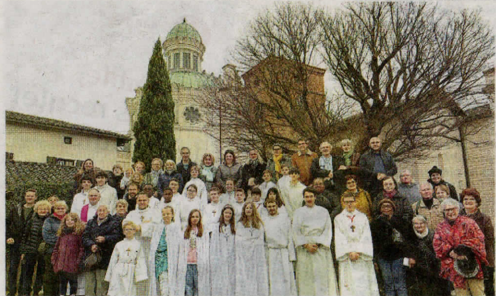
Lors du pèlerinage à Ars-sur-Formans.

L. B. : Dans nos célébrations, les croyants recherchent un sens à la vie, un regard sur l'existence éclairé par la parole de Dieu. On constate que, dans une société qui perd de plus en plus de repères, ou dont les repères ne nourrissent pas forcément l'être profond, nous voyons, ici comme ailleurs, une jeune génération qui se lève et découvre un autre sens à l'existence. C'est cela qu'il est important de retenir. Dans la nuit de Pâques, nous baptiserons deux adultes, une jeune fille de 18 ans et un