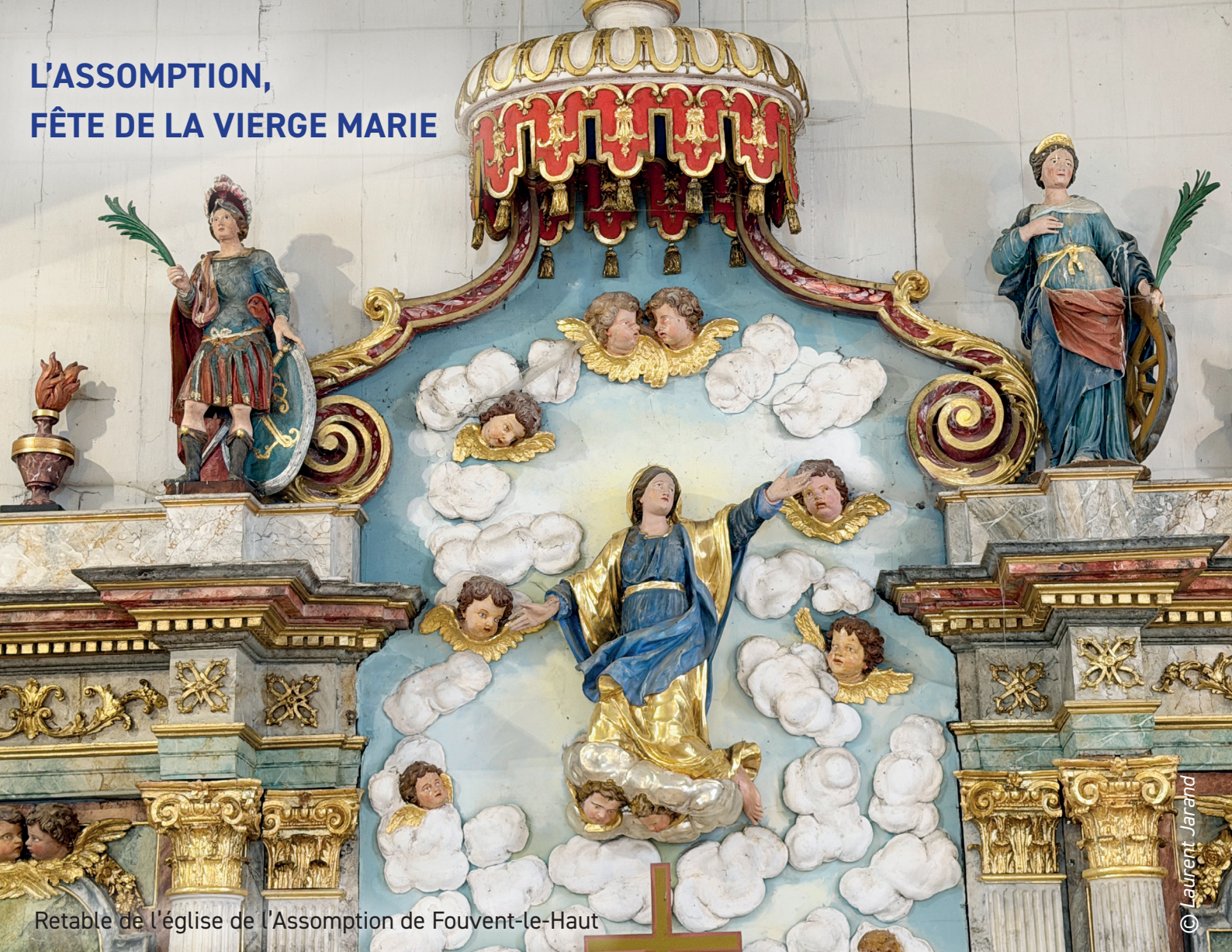
Retable de l'église de l'Assomption de Fouvent-le-Haut