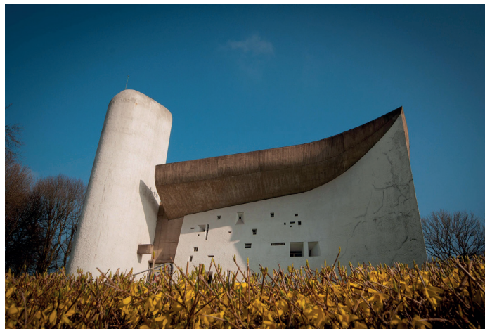
Quête intérieure p.11