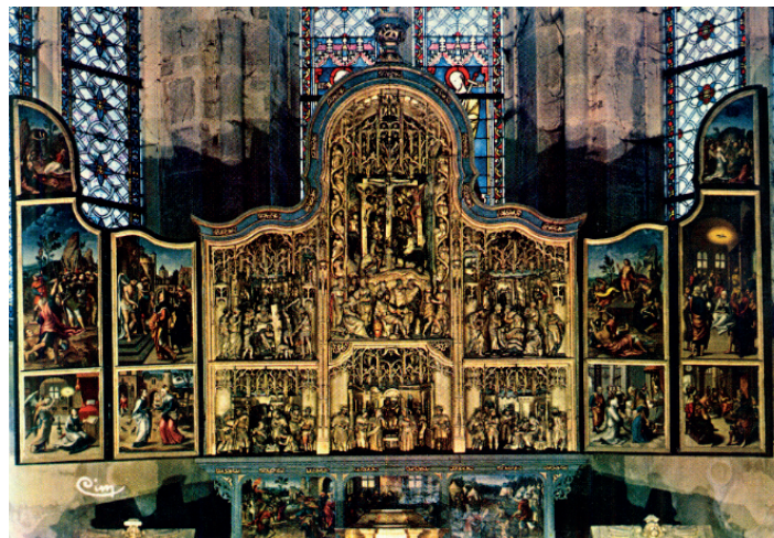
Retable de Baume-les-Messieurs

Perchée sur une colline, elle attire autant la curiosité des amateurs d'architecture que des visiteurs en quête de recueillement. D'autres sites, comme le sanctuaire N-Dame du Mont Roland à Dole, un des plus anciens lieux de pèlerinage en Comté, sont accessibles par un chemin de croix au coeur de la nature.