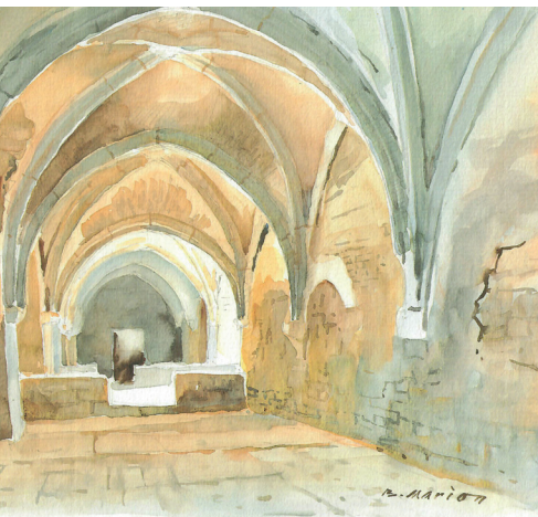
Pèlerinage diocésain p.10