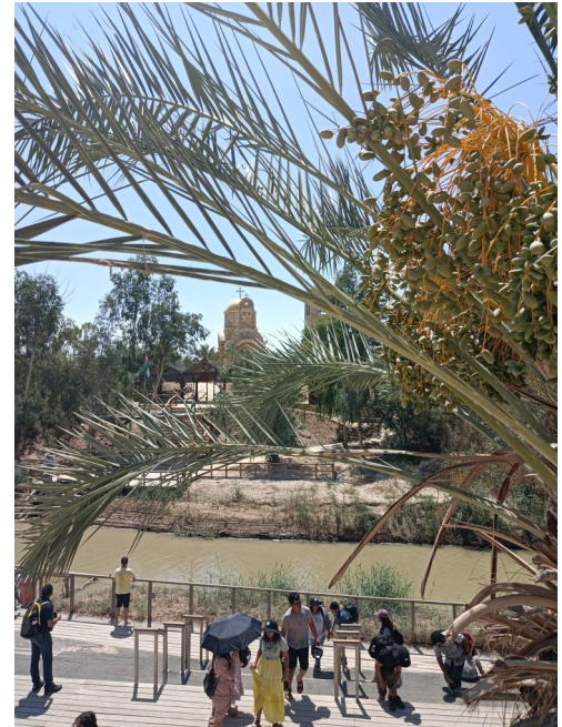
Le Jourdain, avec la Jordanie, sur l'autre rive

de tout mal, de toute illusion, de tout danger préservez-moi.