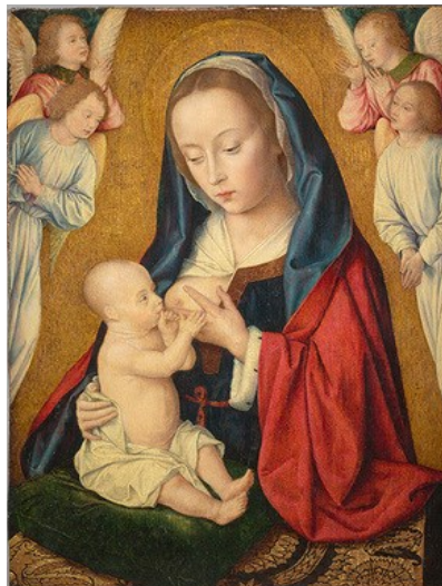
Vierge allaitant l'Enfant, entourée d'anges en prière, par Jean HEY, fin XVe siècle. Musée de Cluny, Paris

Dans nos églises, ou dans nos maisons, jusqu'au 24 décembre, nos crèches de Noël représentent le moment qui précède la naissance, avec Marie, Joseph, l'âne, le bœuf, les anges... tout le monde attend dans un logement sommaire, le plus pittoresque et le plus inconfortable possible, qui va de la grotte préhistorique à la cabane de berger dont le toit fuit... A partir de minuit : même décor, mêmes personnages, mais avec le petit Jésus souriant en plus, et quelques bergers intrigués. Ce que la crèche ne montre pas, c'est l'accouchement. On ne raconte pas que Marie a eu mal, qu'elle a sans doute pleuré, que Joseph ne savait pas quoi faire, que Jésus est sorti comme tous les bébés, qu'il s'est mis à crier (heureusement) jusqu'à ce qu'il comprenne que pour vivre il faut ... téter.