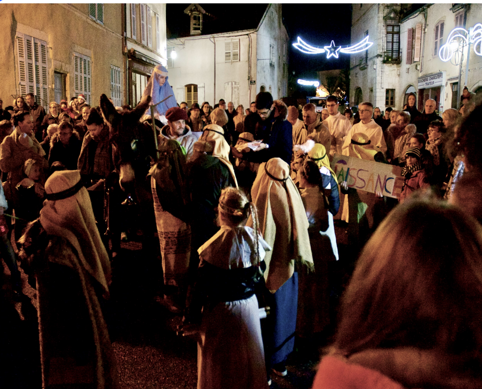
Crèche vivante à Pesmes