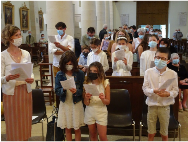
Cérémonie en l'église de Valay.

Ce ne sont pas des célébrations remplies de paroles et de gestes bruyants et qui pourraient faire fuir les plus âgés. Au contraire, ces célébrations organisées pour une durée d'une heure se veulent avant tout priantes et intergénérationnelles. L'enfant a sa place dans l'église où il peut mieux participer à la liturgie, à la prière communautaire. Saint Augustin a précisé, dans les premiers temps de l'Église, que : "Chanter, c'est prier deux fois !" Les chants sont choisis de façon pédagogique afin qu'ils puissent être repris régulièrement par les enfants et les parents qui arriveront à trouver là encore leur place au sein de l'assemblée... en chantant !