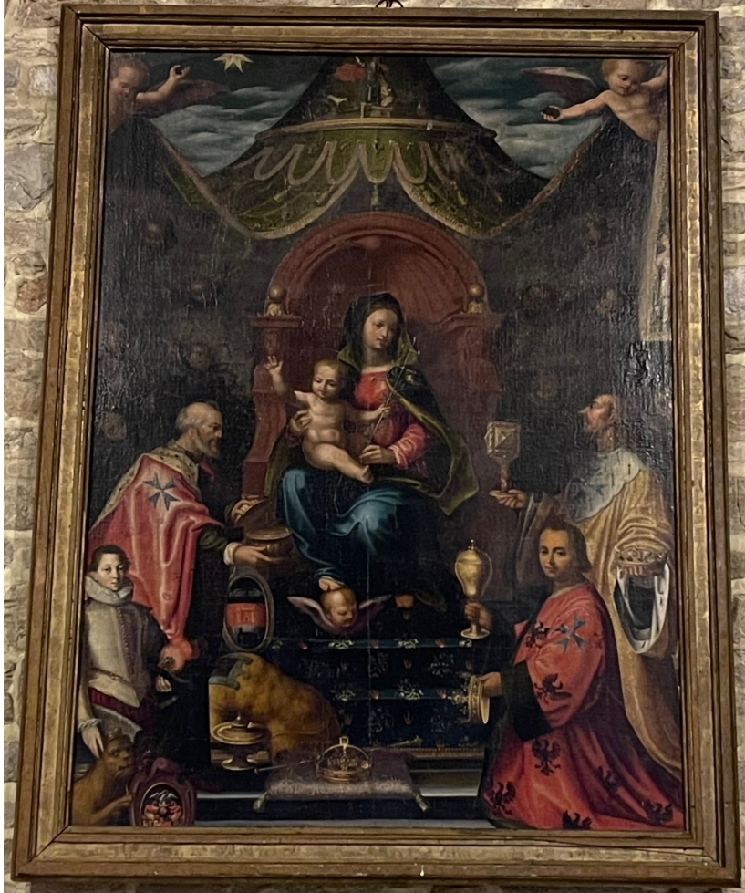
L'adoration des mages. Eglise de Frasne-le-Château. 180 x 125 Auteur inconnu d'après la Vierge de Carondelet de Fra Bartolomeo (cathédrale de Besançon)