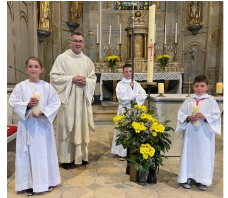
Les servants de la Paroisse de Fresne-Velleuxon.

J'ai commencé à être servante après ma première Communion. J'ai été guidée par mon frère qui servait déjà depuis 2 ans. Servir me permet de trouver le temps un peu moins long pendant la messe et de me sentir utile. En général, j'aime rendre service aux personnes qui m'entourent. Ce que je préfère, c'est porter les bougies, mais ça m'a joué un mauvais tour le premier jour où j'ai servi : Je me suis brûlée une mèche de cheveux ! J'ai compris qu'il était préférable d'avoir les cheveux attachés pour servir la messe !