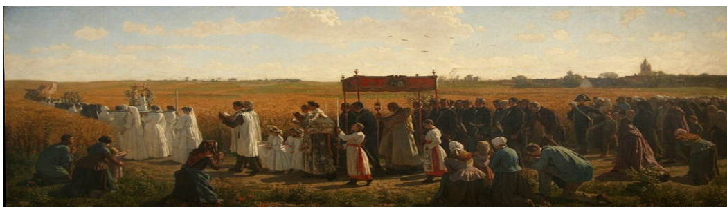
La bénédiction des blés, par Jules BRETON