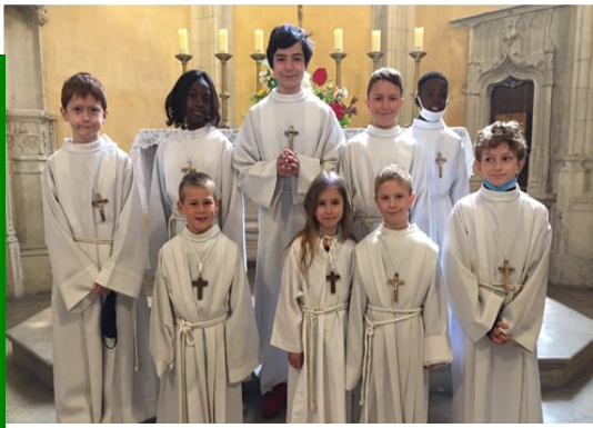
Les servants de la Paroisse de Gray.