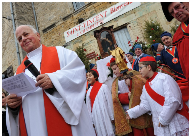
22 janvier 2014. Fête de Saint Vincent, patron des vignerons.