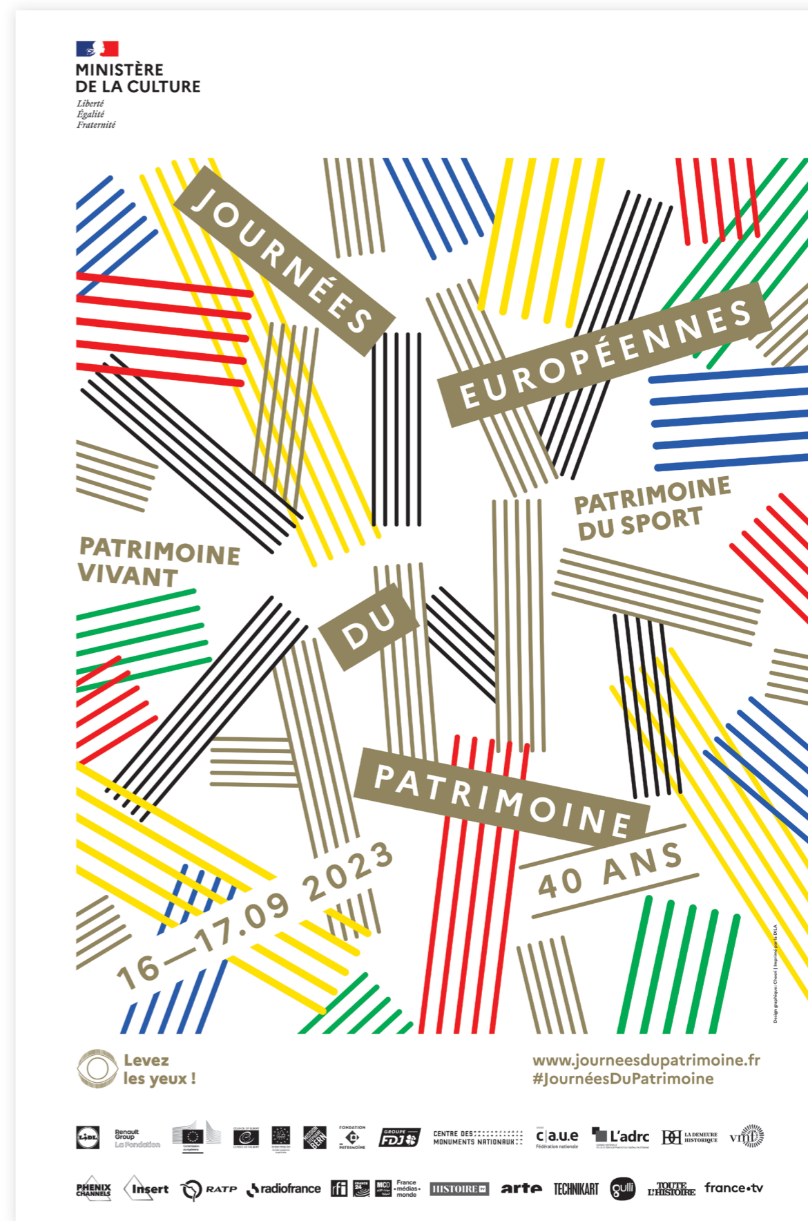
Affiche 40 x 60 cm

Notre existence mais aussi notre patrimoine et son héritage, en aucun cas figés dans le temps grâce à des femmes et des hommes qui s'attachent à la valoriser, l'enrichir pour mieux nous le transmettre. Un patrimoine vivant, c'est aussi la fabrique d'une identité collective, le résultat de trajectoires individuelles qui se rencontrent pour se lier et partager un avenir commun. À travers ces lettrages élancés dont les mouvements se déploient dans et hors du cadre, nous espérons attirer le regard du public. Nous aimerions l'inciter à s'approcher plus près de l'affiche pour déchiffrer le mot dans son intégralité et lui donner envie de sauter à pieds joints dans cette manifestation dynamique pour les citoyens, fédératrice pour les territoires et festive par nature.