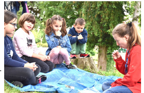
Atelier « chant d'oiseaux »

Nous avons donc décidé d'utiliser les 5 sens pour nos activités : un sens pour chaque stand en rapport avec la nature. Les enfants