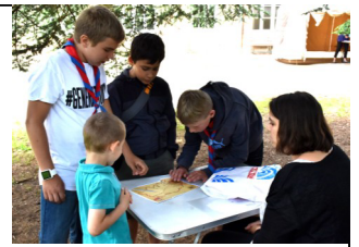
La carte au Trésor