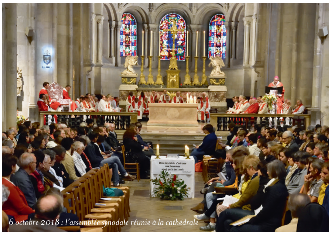
6 octobre 2018 : l'assemblée synodale réunie à la cathédrale

Le conseil pastoral diocésain est défini par les canons 511-514 du Code de Droit Canonique de 1983. À compter du 6 octobre 2019, le nouveau Conseil diocésain de pastorale sera constitué, pour les trois années à venir, des membres de l'assemblée synodale. Je les réunirai pour une rencontre annuelle de travail 5 afin d'étudier ce qui concerne l'activité pastorale du diocèse, d'évaluer les mises en œuvre des décrets synodaux et de faire des propositions. Prochainement, j'inviterai chaque membre de l'assemblée synodale à se prononcer personnellement sur son désir de prendre cet engagement.