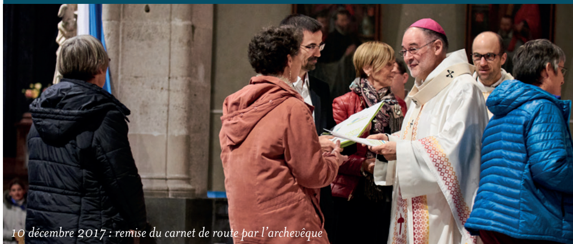
10 décembre 2017 : remise du carnet de route par l'archevêque

Une attention particulière a été apportée pour s'assurer que le synode était bien accessible à chacun. Il a été fait en sorte que le carnet de route puisse être utilisé par un maximum de personnes. En complément d'une impression à 7 000 exemplaires, ce carnet a parallèlement été enregistré dans une version "à écouter" disponible sur le site internet. Le texte brut et les images étaient téléchargeables pour être imprimés en grand format si nécessaire. Le contenu des fiches basé sur différents médias (textes, images, vidéos) a également permis de trouver un outil propice pour débiter les échanges en fonction de la sensibilité de chacun. Pour rendre également possible le dialogue avec les personnes moins sensibles aux thèmes centrés sur l'Église, une fiche Parole libre a été proposée, avec un "photolangage" et un message introductif traduit en anglais et en arabe, et avec des questions plus ouvertes. Enfin, une fiche Enfants a été conçue pour recueillir les mots des plus jeunes (en catéchèse, en mouvements...).