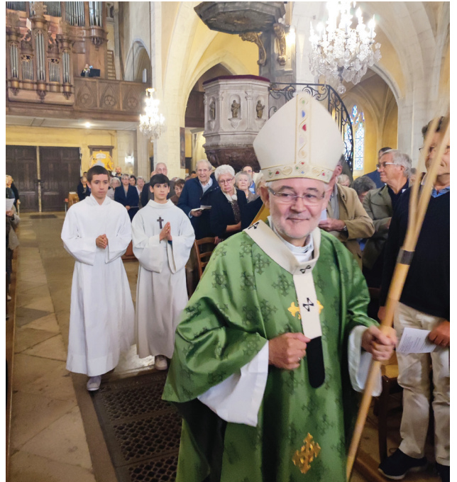
Une présence bienveillante