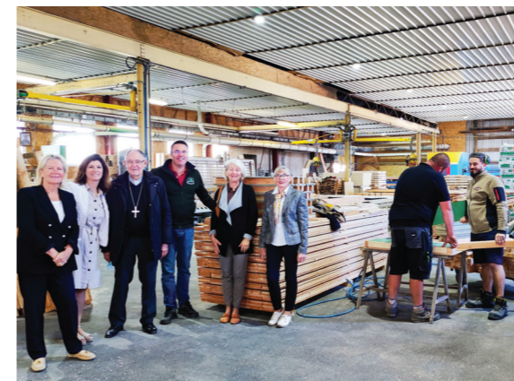
Au contact de l'économie locale à la scierie Mirbey