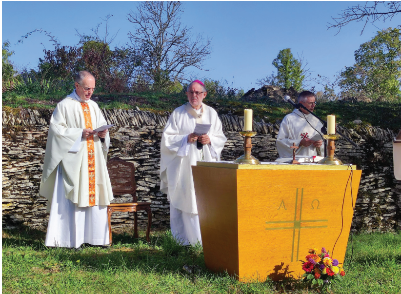
Grand moment d'émotion au clos des Lavières à Champlitte