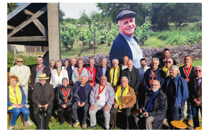
Au musée des Arts et Techniques de Champlitte, les confréries réunies