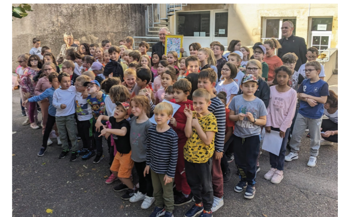
Au groupe scolaire St Pierre Fourier, un moment rajeunissant !