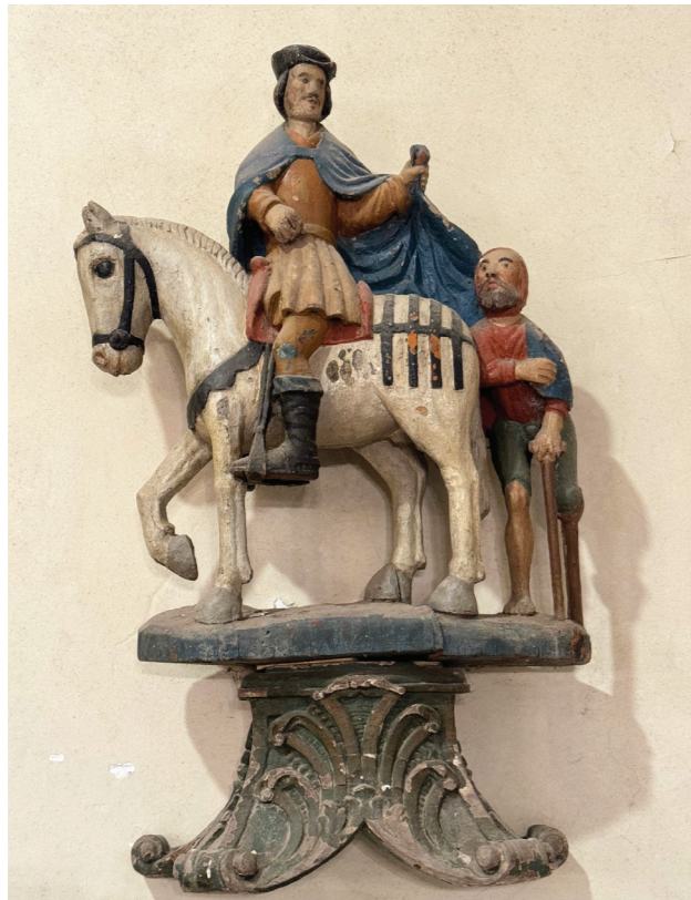
Statue en bois polychrome de St Martin XVII e s, église d'Argillières.

Quand on tient fortement, passionnément à son idée, on a peine à admettre que le voisin puisse tenir aussi fortement à la sienne. Une position dans laquelle on s'engage envahit facilement tout le champ de la conscience et fait obstacle à la compréhension d'une autre position, d'un autre choix.