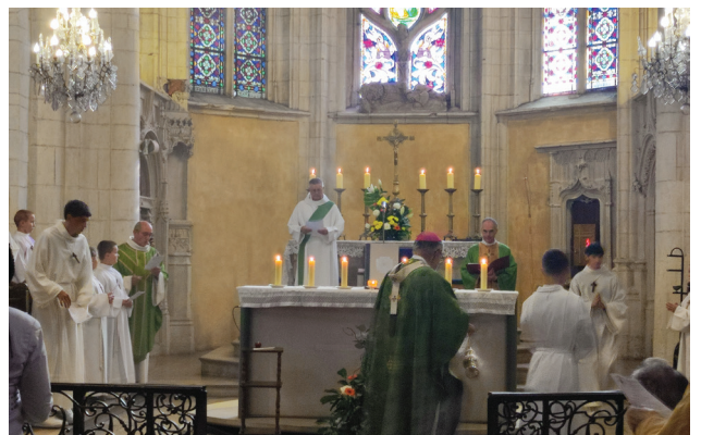
Pour les servants, une cérémonie marquante