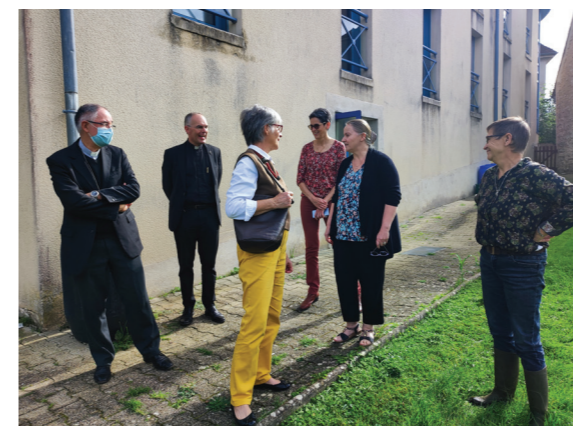
La Maison bleue, un lieu convivial et stimulant