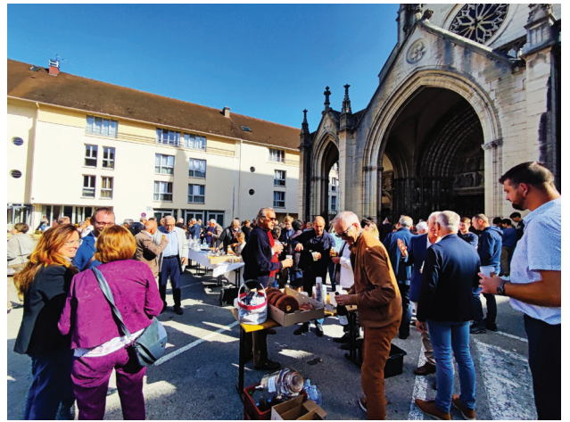
Moments de rencontre sur le parvis de la basilique de Gray