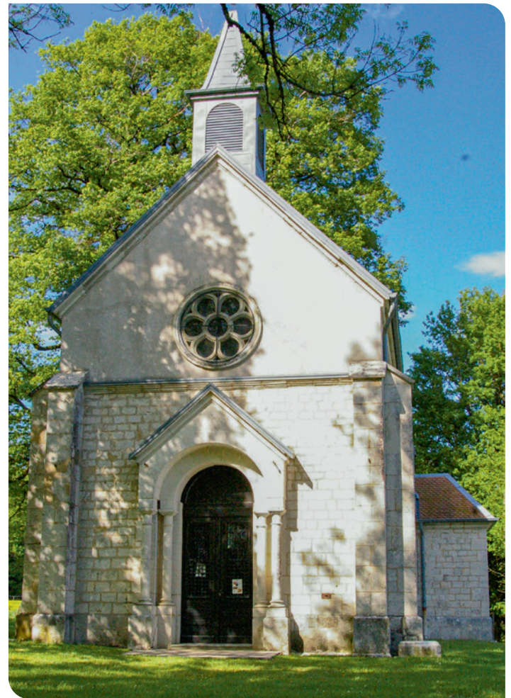
La chapelle Saint-Maximin