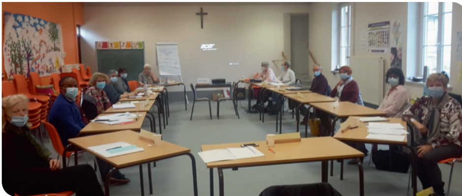
La journée de travail sur l'accueil en Église, le 5 mars à Amancey.