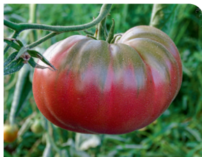
Le plaisir de cultiver ses tomates !