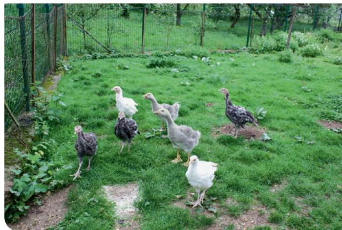
Voilà des recycleuses sympas !