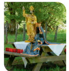
Saint Maximin et la vierge noire d'Einsiedeln placés côte à côte pour l'office du 26 mai 2019.

Sources : Dico des Cnes de Dbs. La semaine religieuse. Les archevêques de Besançon du Cdt Surugue. Vie des saints de F. Cté (Divers auteurs). Gilberte Genevois : site internet Saint-Jacques. Info. Histoire de Besançon de Claude Fohlen. / Remerciements : Loïc Laporte.