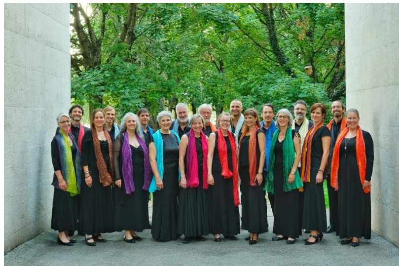
Le chœur Yaroslavl' à Neuchâtel en 2022