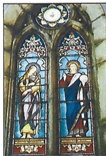
Vitrail côté gauche Sainte Madeleine et Jésus Sauveur

Deux vitraux doubles finement dessinés et aux couleurs chatoyantes éclairent l'intérieur de la chapelle meublée sobrement.