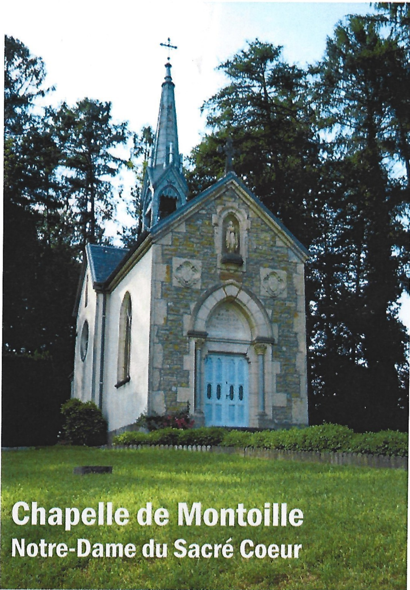
Chapelle de Montoille Notre-Dame du Sacré Coeur