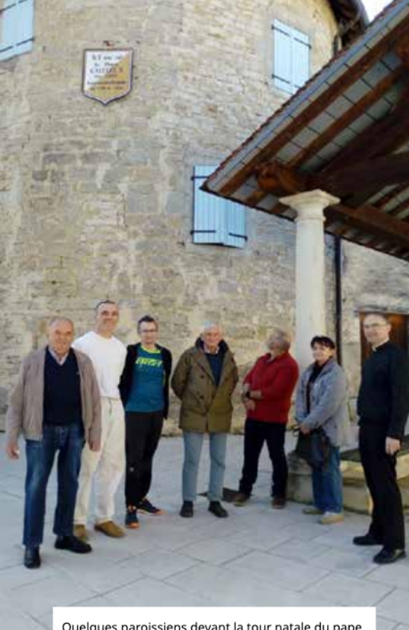
Quelques paroissiens devant la tour natale du pape