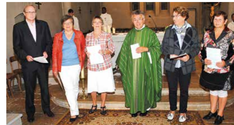
De gauche à droite : nommer les personnes ?????????????????????????????????