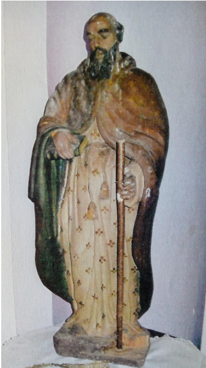
Saint Antoine de l'église de Mesmay, statue en bois peint du XVII e siècle.

Le sanctuaire des Trois-Épis fut visité par notre Paroisse lors du pèlerinage de 2018. Aujourd'hui encore, le dimanche le plus proche du 17 janvier, fête de Saint-Antoine, la Messe est célébrée aux Trois-Épis en l'honneur du saint et selon une vieille tradition, on distribue aux pèlerins à la sortie de la messe les "petits pains bénis de Saint-Antoine", de délicieux petits gâteaux à l'anis.