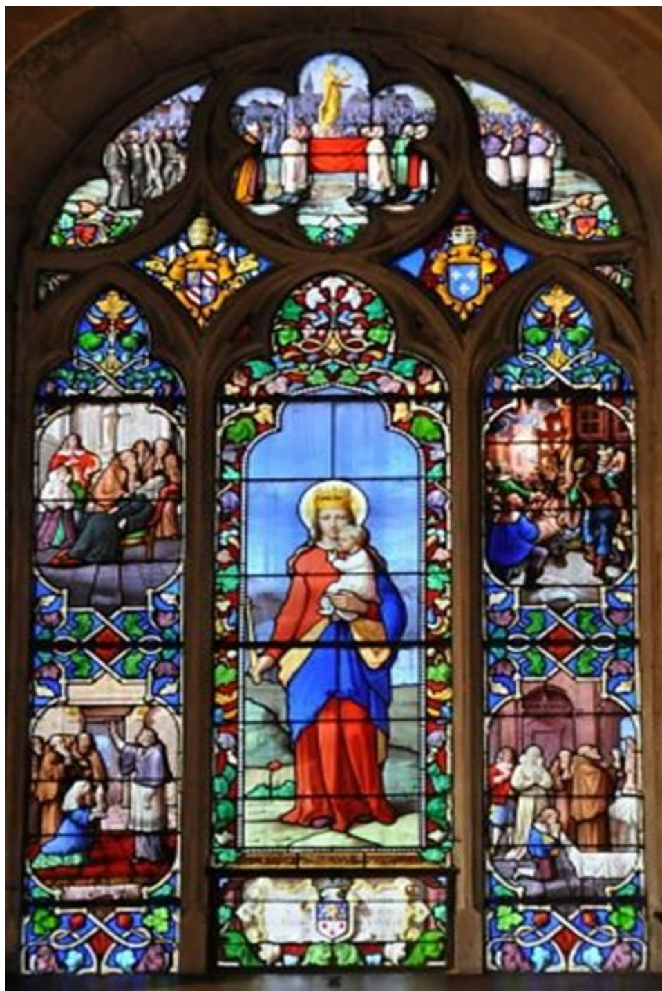
Notre Dame de Gray.

L'autorisation papale fut finalement accordée en 1907.