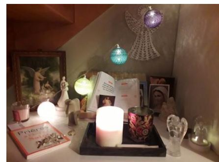
Coin prière d'une de nos paroissiennes

Aménager un coin prière chez soi, c'est rappeler la présence de Dieu à chaque moment de la journée, à chaque instant de votre vie quotidienne. Il aide à se mettre en Sa présence, à être plus conscient que Dieu est avec vous en tout lieu. Rien de mieux pour donner à Dieu une place qui invite les uns et les autres au recueillement.