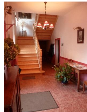
Photo de l’escalier de la cure de Quingey

Les gens sont déraisonnables, illogiques et égoïstes, aimez-les tout de même ! Si vous faites le bien, les gens vous prêtent des motifs égoïstes ou calculateurs, faites le bien tout de même ! Si vous réussissez, vous gagnerez de faux amis et de vrais ennemis, réussissez tout de même ! Le bien que vous faites sera oublié demain, faites le bien tout de même ! L’honnêteté et la franchise vous rendent vulnérable, soyez honnête et franc tout de même ! Ce que vous avez mis des années à construire peut être détruit du jour au lendemain, construisez tout de même ! Les pauvres ont vraiment besoin de votre secours mais certains peuvent vous attaquer si vous les aidez, aidez-les tout de même ! Si vous donnez au monde le meilleur de vous-même vous risquez d’y laisser des plumes, donnez ce que vous avez de mieux tout de même !