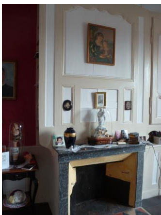
Cure de Quingey

Confinés, vous êtes peut-être en train de prendre conscience qu'il y a certains bienfaits de ce temps imposé et donné à la fois. Freiner, prendre du recul, cultiver vos relations avec les proches, être plus connecté à soi-même... Enfin, faire de sa maison un lieu pour l'âme... Comme le salon, ce lieu qui réunit toute la famille loin du stress et du chaos extérieur où la joie de vivre et l'amour sont célébrés, en toute simplicité, en retournant à l'essentiel. Comme le met en lumière cette prière composée à l'occasion de la rencontre mondiale des familles en 2018 :