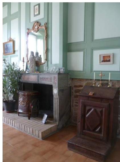
Photo de la salle à manger de la cure de Quingey

Lieu de convivialité, de retrouvailles familiales autour de la table, lieu du partage de la nourriture, la salle à manger est l'endroit par excellence où l'on peut rendre grâce pour les dons de la Création. Le bénédicité et les grâces sont de courtes prières dont l'objectif est justement de placer le repas sous le regard de Dieu, de le remercier pour les biens terrestres dont il nous comble et de lui confier les personnes qui manquent de pain. L'idée est de « s'arrêter pour rendre grâce à Dieu », souligne le pape François dans Laudato Si' . « Ce moment de la bénédiction, bien qu'il soit très bref, nous rappelle notre dépendance de Dieu pour la vie, il fortifie notre sentiment de gratitude pour les dons de la création, reconnaît ceux qui par leur travail fournissent ces biens, et renforce la solidarité avec ceux qui sont le plus dans le besoin », précise le Saint-Père.