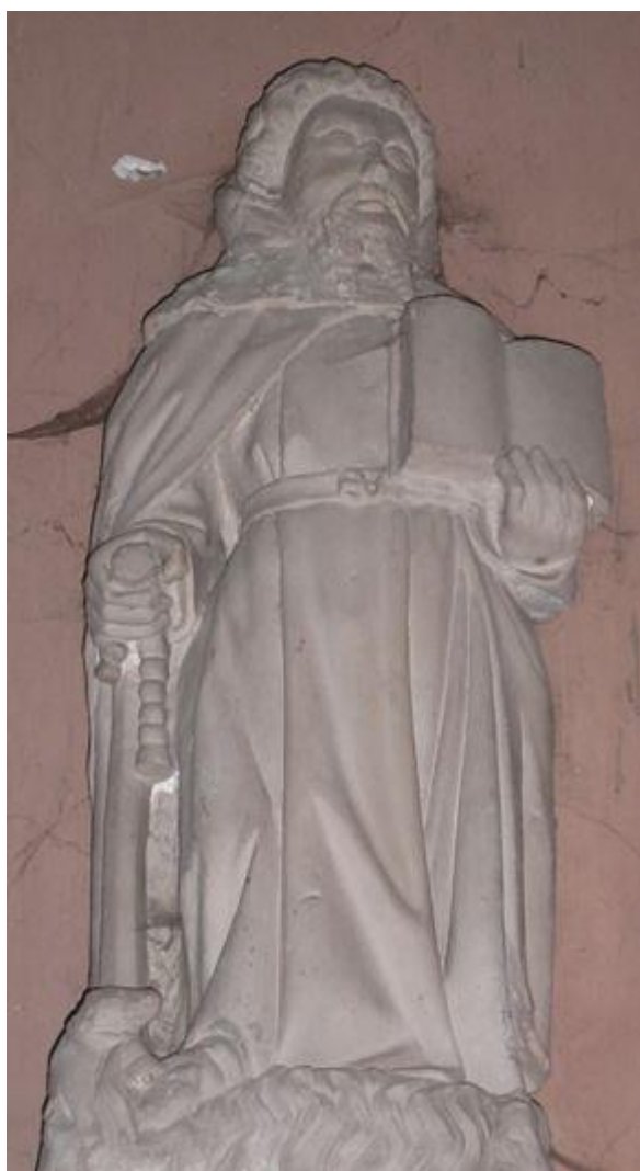
Saint Antoine à l'église de Buffard, statue du XVIème siècle.

Les chrétiens d'Orient ont décidément beaucoup à nous apporter en ce temps d'épidémie. Nous avons appris lors du dimanche de la Miséricorde (et de la Foi) que notre saint patron était appelé Saint Martin le miséricordieux par les églises d'Orient. Aujourd'hui nous allons découvrir Saint Antoine le Grand (ou l'ermite), le véritable père du monachisme, père de tous les moines.