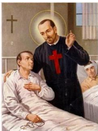
Saint Camille de Lellis

Enfin, une note historique sur un saint qui a été confronté à une épidémie :