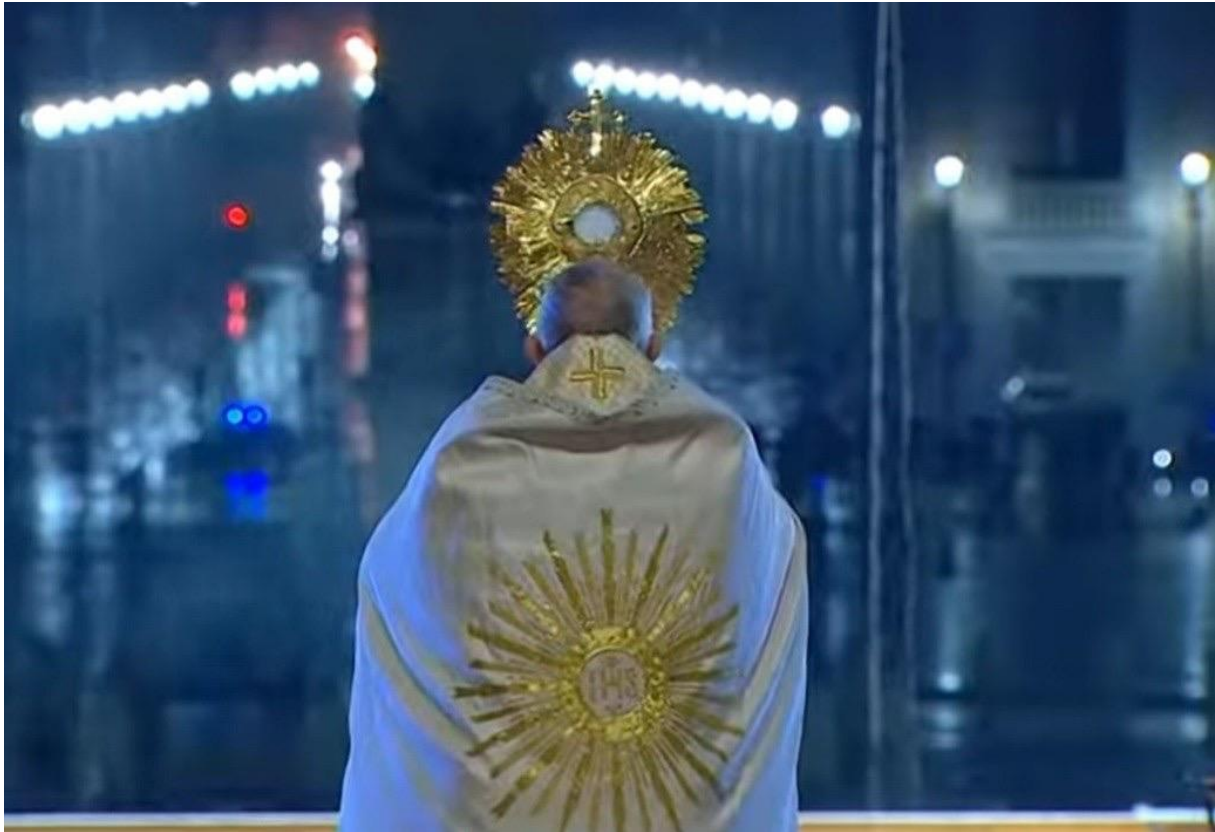
Bénédition du pape sur le monde, le 27 mars 2020 depuis la place Saint-Pierre au Vatican.

Le samedi 27 mars, le pape a béni avec le Saint Sacrement le monde entier, « urbi et orbi », c'était impressionnant de le voir seul marcher sur la place Saint Pierre, habituellement noire de monde, là, vide et immense face à la petite silhouette de l'homme en blanc ! A la suite, bien des cardinaux, évêques, prêtres ont béni leurs diocèses et paroisses, je m'inscrits ainsi dans cette démarche, soyons là encore en communion et recevez ce bien et cette force de la part du Seigneur !