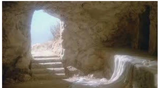
Le tombeau de Jésus ouvert

Ô tombeau creusé dans le jardin Au milieu des fleurs, Saint tombeau du Corps très pur de mon Seigneur. Et maintenant il est ton jardinier. Ô saint tombeau vide Au milieu des fleurs Du nouveau jardin d'Éden !