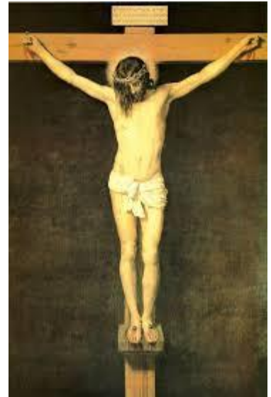
Christ en croix - Diego Velázquez - vers 1632