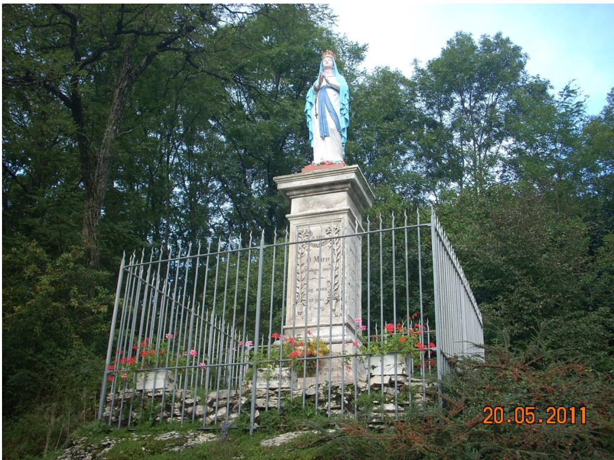
Statue de Notre Dame de Lourdes, route d'Ornans à Quingey

Le Jeudi Saint, j'aurais aimé gravir le sommet de la paroisse, me rendre à By, mais je n'en ai pas l'autorisation, c'est donc depuis un espace de prière élevé, à moins d'un kilomètre de la cure, à la route d'Ornans, que je me rendrai.