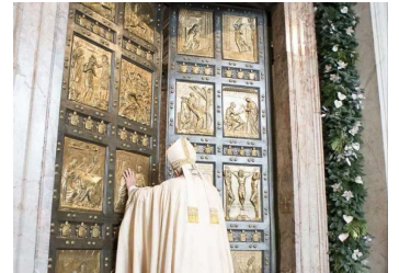
Ouverture de la "Porte Sainte"