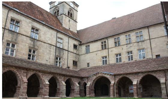
Le cloître de l'abbaye