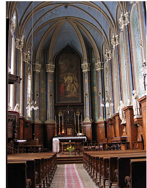
Chapelle de l'abbaye